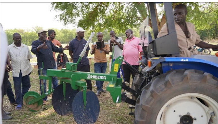
Photo prise le 18 mai 2021 lors de la formation au CEEMA à Samanko

A noter, que les femmes étaient très peu représentées. La participation a été très active et le temps de formation était trop court pour l'ensemble des équipements présents : 2 tracteurs de puissance 28 CV et 65 CV et un ensemble d'environ 10 équipements. Des recyclages devront être planifiés ultérieurement. Des formations hybrides ou 100 % digitales pourront aussi être prévues sur des thèmes ne nécessitant pas la présence des partenaires : calcul économique, aspect logistique ou de gestion de parc mécanique.