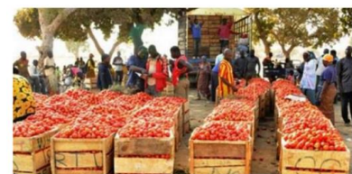
Vente de tomate au Mali, Source: http://malijet.com/actualite_internationale/150244-production-de-la-tomate-la-galere-des-maraichers-de-di.html

Depuis 2015, Baguinéda possède une usine de production de concentré de tomate, ce qui participe positivement au développement de la chaîne de valeur. L'usine a des contrats d'achats avec l'Union des sociétés coopératives agricoles de Baguinéda et plus de 300 paysans. Cependant, les producteurs ne peuvent pas livrer de tomates en raison, entre autres, d'importants problèmes de pourriture brune lors de la campagne 2016-2017. Cette maladie est due aussi au fait que la bonne pratique du vide sanitaire n'est pas respectée. Il s'agirait d'enlever tous les restes végétaux des terrains après la récolte, et de les détruire, empêchant ainsi la propagation de la virose. Le problème illustre la signification économique énorme de l'adoption de bonnes pratiques de maraîchage, ce qui devrait être également pris en compte lors de nos formations.